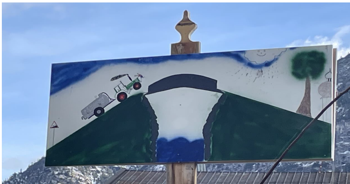
Zukunftsvisionen für die Gries-Brücke – Dank an den Künstler und die Ideengeber.

Bei bestem Wetter hat der VTV Ettaler Mandl für einen schönen Ausklang der Faschingszeit gesorgt. Vielen Dank an alle Organisatoren und Beteiligten – Schee war´s!