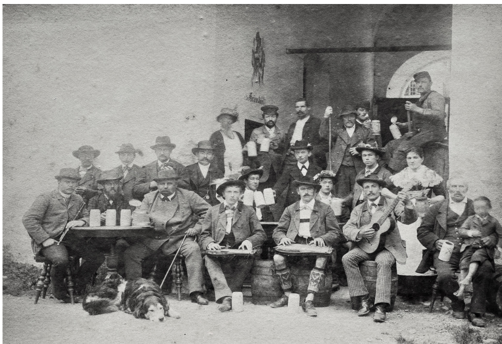
Ettaler Bürger vor dem Bräustübl um 1900

In der Gründungssatzung ist als Zweck des Vereins zu lesen: Erhaltung und Hebung der Werdenfelser Volkstracht sowie Pflege der Musik.