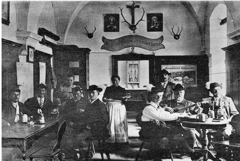
Im alten Bräustübl um 1900

Der Volkstrachtenverein „Ettaler Manndl“ wurde am 26. März 1899 durch acht Ettaler Bürger im alten Klosterbräustübl, das sich neben der Brauerei befand, gegründet. Gründungsvorstand und Initiator war Constantin Reichenbach. Auch ist zu vermuten, dass der Dienstherr von Reichenbach, der Besitzer des damaligen Klosterguts Theodor Freiherr von Cramer-Klett, die Gründung des Vereins angeregt hatte. Cramer-Klett war selbst begeisterter Trachtler und er trat auch dem Ettaler Verein bei.